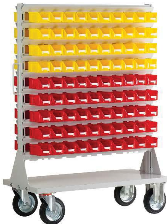
FA M 180 Einhängeregal BM 2seitig Aussenmasse: 1150x500x1570 mm mit 20 Aufhängeschienen