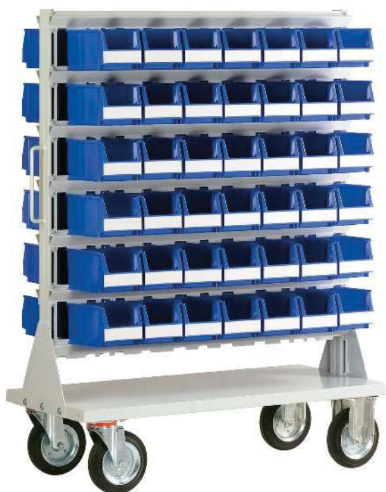
SB M 84 Einhängeregal BM 2seitig Aussenmasse: 1150x500x1570 mm mit 14 Aufhängeschienen