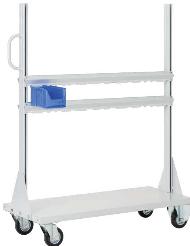
BM Grundgestell BM Aussenmasse: 1150x1570 mm je 2 Lenk- & 2 Bockrollen Ø125 mm

Lieferumfang s. Kapitelseite Aufhängeschienen s. Kapitel Standplus